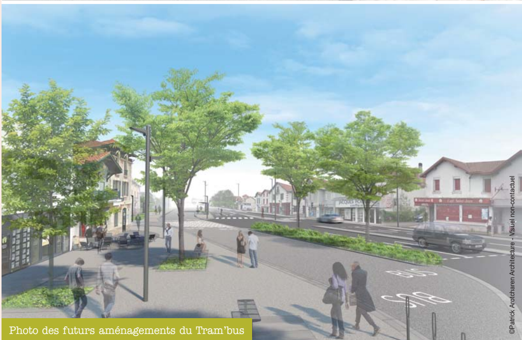
Photo des futurs aménagements du Tram'bus