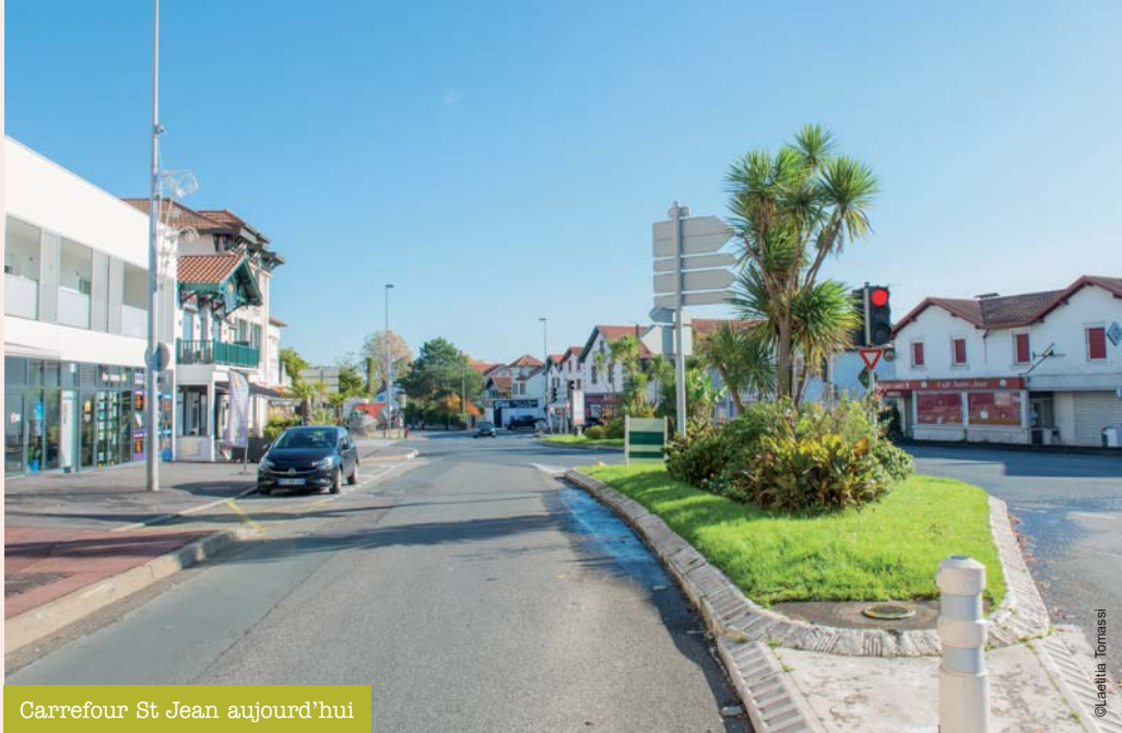
Carrefour St Jean aujourd'hui