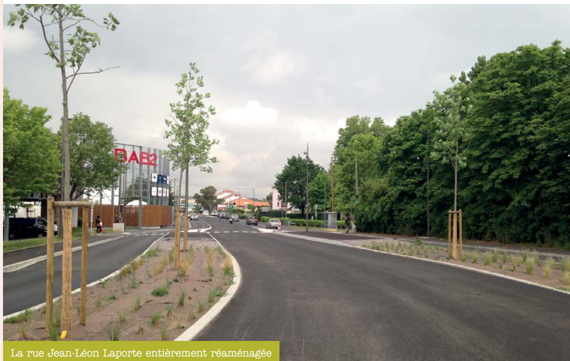
La rue Jean-Léon Laporte entièrement réaménagée

Après plusieurs mois de travaux, la ligne 1 du Tram'bus se dévoile peu à peu à Anglet. Les futures voies sont presque terminées entre les carrefours d'Atchinette et des Barthes. Avec elles, c'est toute la rue Jean-Léon Laporte qui se voit totalement transformée. De larges trottoirs ont été aménagés de chaque côté de la chaussée afin de rendre le cheminement piéton plus confortable et accessible à tous. 90 arbres et arbustes adaptés au milieu urbain, 6 000 fleurs et graminées ont été plantés le long du tracé, rue Jean-Léon Laporte. Ainsi, avec l'arrivée du Tram'bus, l'ensemble de l'espace public se réinvente pour le bien-être de tous.