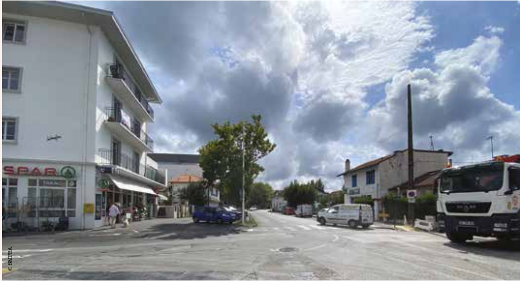
Les travaux se poursuivront sur l'avenue du 8 mai 1945 en direction de Technocité

Entre Saint-Léon et Technocité près de 2 km de pistes cyclables sécurisées seront aménagées. Elles permettront le développement de l'usage du vélo.